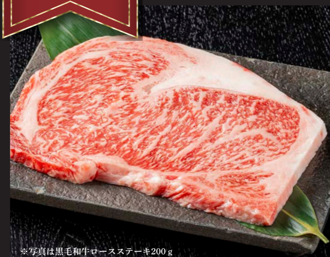
※写真は黒毛和牛ロースステーキ200g