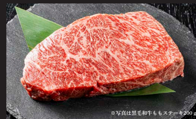
※写真は黒毛和牛ももステーキ200g