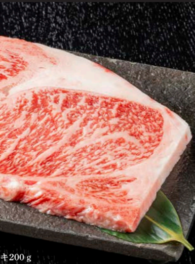
※写真は黒毛和牛ロースステーキ200g