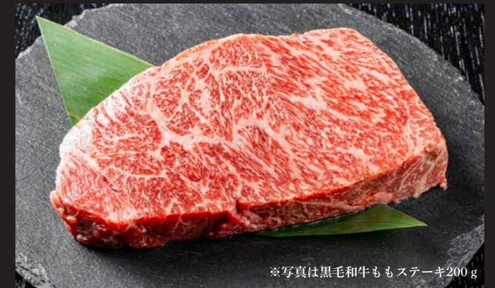
※写真は黒毛和牛ももステーキ200g

100g 1,800円(税込) 150g 2,700円(税込) 200g 3,500円(税込)